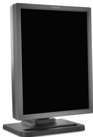
Dome E3n 数字平板显示器

检查你的 Dome E3n 显示器包装箱内的内容，所有部件都列在下面。 为了将来运输和储藏的需要，请妥善保存所有包装材料。